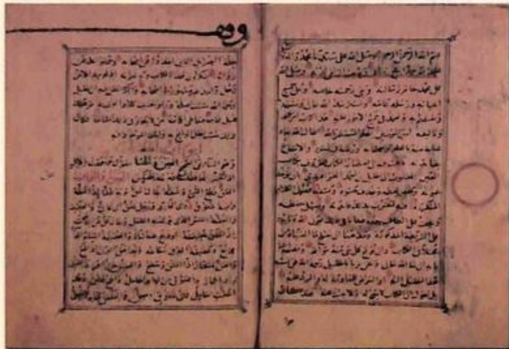
الورقة الأولى والثانية من كتاب: «مختصر العين»، ألفه النحوي المؤرخ محمد بن الحسن الزبيدي الأندلسي (ت ٣٧٩هـ)، بأمر من المستنصر بالله.