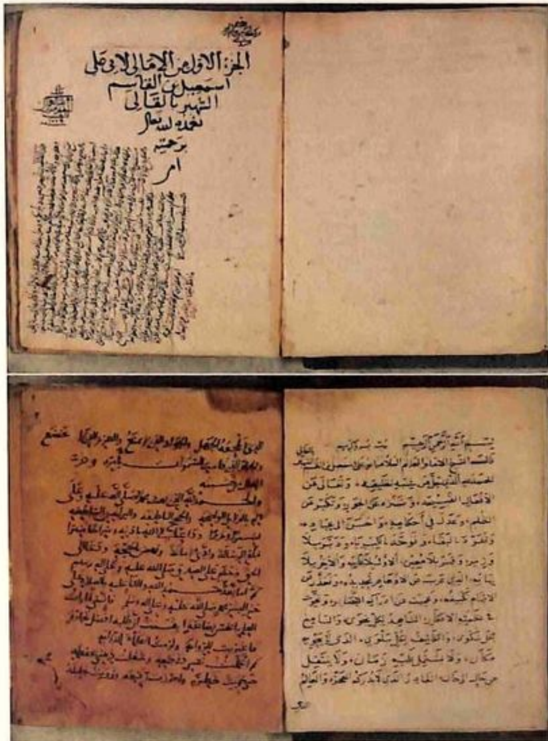
الورقة الأولى والثانية من كتاب: «الأمالي»، للعلامة اللغوي أبي علي إسماعيل القاضي البغدادي (ت ٥٢٥٦هـ)، ألّفه للمستنصر بالله أيام كان ولياً للعهد.