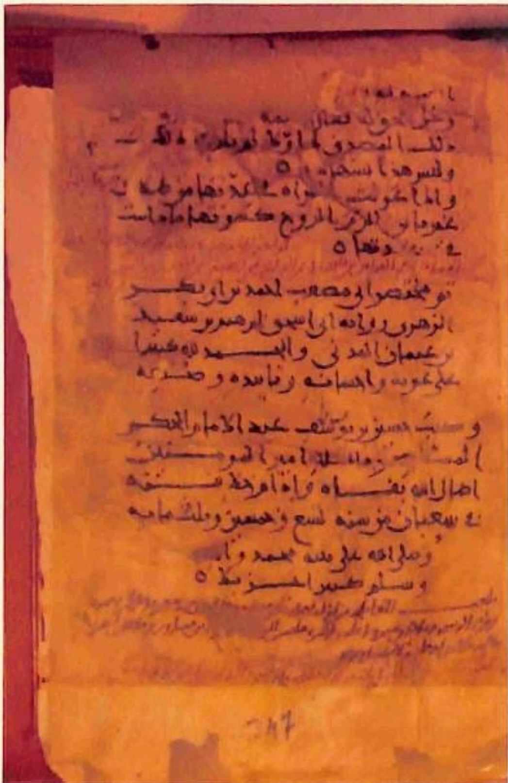
الورقة الأخيرة من مختصر الإمام أبي مصعب أحمد الزهري (ت ٢٤٢هـ) في الفقه المالكي، وقد نسخه حسين بن يوسف -عبد أمير المؤمنين المستنصر بالله- سنة ٢٥٩هـ.