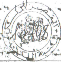
الصفحة الأخيرة من النسخة : «ب»

وما يظن بعلمهم والمطابق فوكلوا اليك من الوحيات لا يجمع به الخلق ولا يعلفه الا بالليلتين وعمل العبد ان قلة الله مع الصالحين ويؤمن خلقها ضاعا اليه ويؤمن في كثير الله ومن الصلاة على رسول الله صلى الله عليه وسلم في صلاة القلب وسعادة العبد في الدنيا والآخرة وطلب الله على يدنا بحجزة اليه وصحبه وسلم تسليما بحمد الله تعالى الميامن الحلال في عالمي محمد بن عبد الوهاب في حيدرآباد في شهر ربيع الثاني في سنة 1295 هـ في يوم الاثنين في شهر ربيع الثاني في سنة 1295 هـ