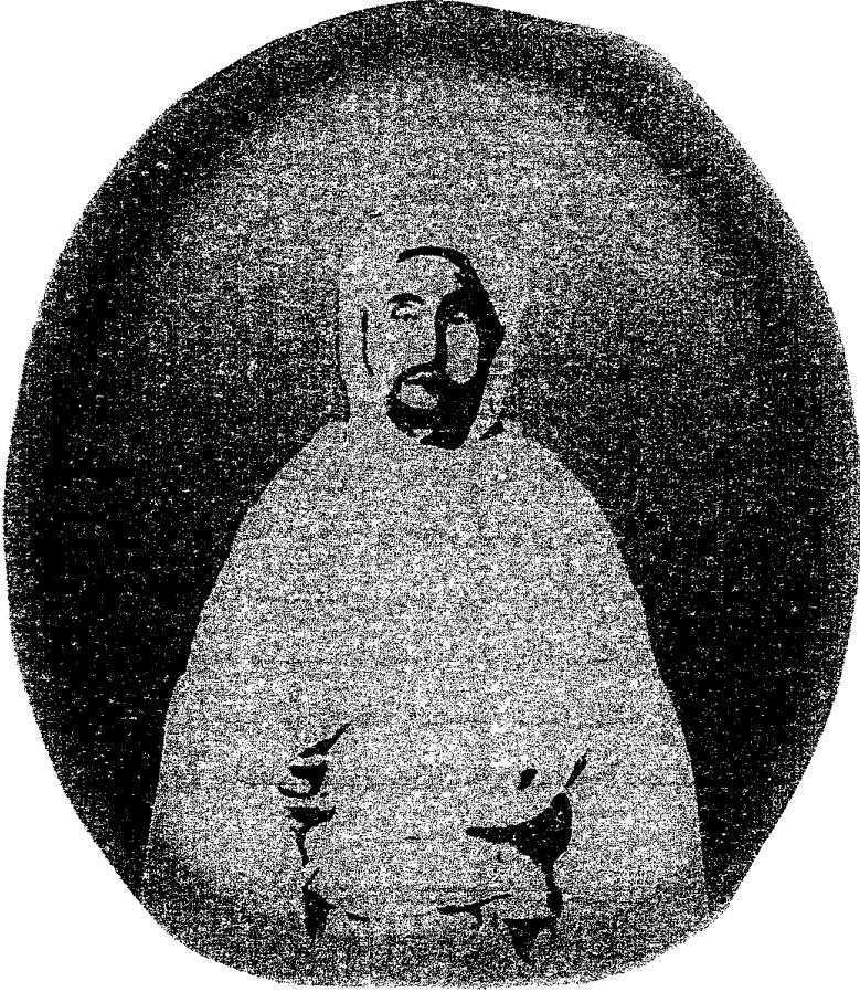
صورة العلامة محمد بن الحسن الحَجّوي الثعالبي الفاسي