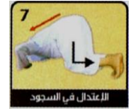
الإعتدال في السجود