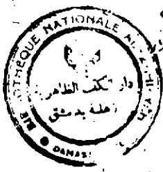
صفحة العنوان من نسخة الظاهرية (ع)