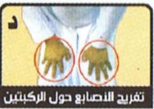
تفريغ الاصابع حول الركبتين

أ. «سبحان ربي العظيم» رواه أحمد صححه الألباني والواجب أن يقولها مرة وما زاد فهو سنة