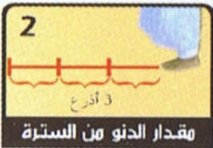
مقدار الدنو من السترة

④ يكبر تكبيرة الإحرام قائلا: «الله أكبر» ويرفع يديه