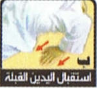
استقبال اليدين القبلة