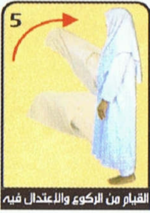
القيام من الركوع والاعتدال فيه

ج. ((سبوح قدوس رب الملائكة والروح)) رواه مسلم