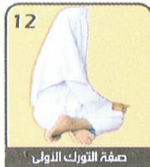
صفة التورك الاولى

قدميه من ناحية واحدة ويجعل اليسرى تحت فخذه وساقه وينصب اليمنى» رواه البخاري