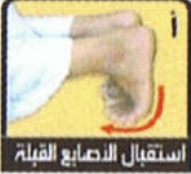
استقبال الاصابع القبلة

لما ثبت عنه ﷺ أنه: ((كان يكبر ويهوى ساجدا))