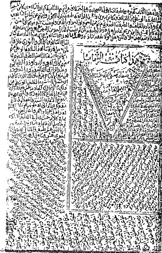
راموز الورقة الاولى من نسخة «هـ» ويظهر فيها الشرح وبعض النقول من الحافظ ابن حجر حول طبقات الرواة