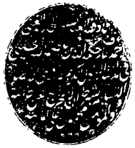
الورقة الأخيرة من نسخة مكتبة عارف حكمت

ويا اهل النار خلود ولا موت فهذا آخر احوال هذه النطفة التي هي مبتدلاتان وما بين هذه المبراة وهذه الغائبة احوال وطبقات قود العز من العليم بتقل الان فيها لو يكون لها طبقا بوطيق حتى يصل لها ما يشتم من العلة والشقاوة قتل الا بل ما اكف مما في شدة خلقهم من نطفة خلقهم فقوت ثم السيل يتوه ثم ماتت فاقبوه ثم اذا شاء الله كلفها يقض امره فساله العظيم ان يجعلنا من الذين سبق لهم من الله ولا يجعلنا من الذين غلبت عليهم الشقاوة في الدارين والآخر انه سمع الدعاء وهو حسبان ونعم الوكيل والارادة رب العالمين وصلى الله على سيدنا محمد وآله وصحبه وسلم تليها كغيرها اليوم الدين تم بمؤامنه ويطعم ٦٤