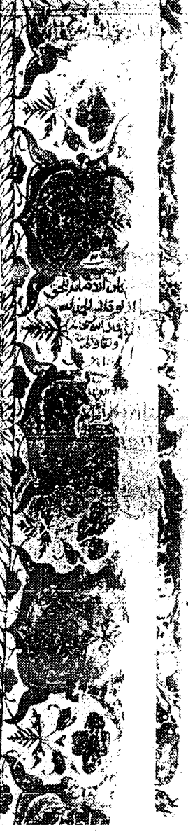
الورقة الأولى / ب من النسخة (خب)