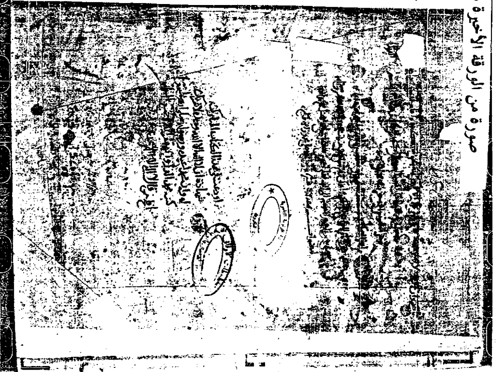
صورة من الورقة الأخيرة من النسخة الأصل