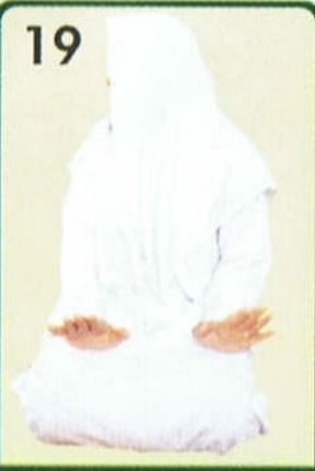
الإشارة في التسليم

عليكم ورحمة الله . السلام عليكم ورحمة الله . وأشار بيده إلى الجانبين فقال رسول الله ﷺ: « مالي أراكم ترفعون أيديكم كأنها أذنان شمس فتركوا الرفع واكتفوا بالتسليم . » رواه مسلم وابن خزيمة أنظر الصورة 19 الصواب : التسليم يمينا وشمالا بدون إشارة